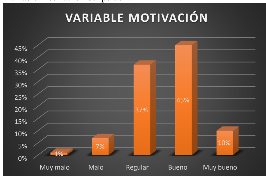
Gráfico 1 Variable motivación del personal