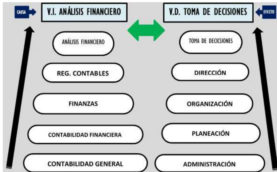
Figura 1: Superordenación Elaborado por: El Ejecutor