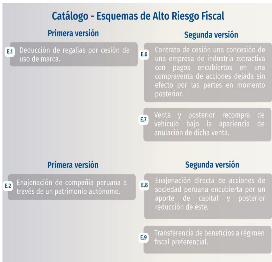
Figura 2 Alto riesgo fiscal

Nota: Obtenida de (Alto riesgo fiscal, 2022)